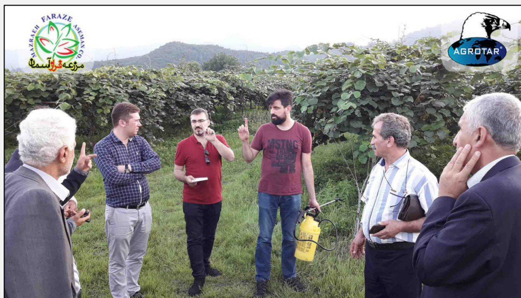
شکل ۱. مدیرعامل و مدیر فنی شرکت آگروتار ترکیه در حال ارائه توضیحات برای باغداران در مورد نحوه مصرف مستر داوینچی

گلدهی کامل باغات کیوی در اردیبهشت اتفاق افتاد و پس از ریز شکوفه و تشکیل میوه، هرس میوه به طور معمول توسط باغداران انجام شد. عملیات باغی رایج نیز طبق سنوات گذشته صورت پذیرفت. چهار هفته پس از گلدهی، یعنی در خرداد ۱۳۹۶، پس از هماهنگی انجام شده با نمایندگان شرکت در شهرهای تالش و آمل، در اوایل خرداد ۱۳۹۶ به دلیل اهمیت این محصول مدیر واحد تحقیق و توسعه شرکت مزرعه فرازه آسمان به همراه مدیرعامل و مدیر فنی شرکت آگروتار ترکیه در مناطق مذکور حضور یافته و شخصا نسبت به اجرای آزمایش اقدام نمودند (شکل ۱).