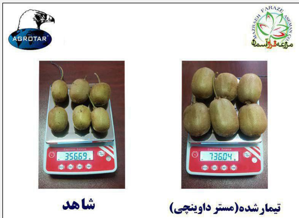
شکل ۴. اثر مستر داوینچی بر روی وزن میوه های کیوی